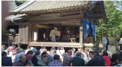
四所神社：歓声も上がり大盛り上がりでした