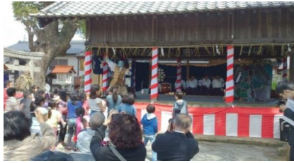
八坂神社：地元の小中学生が舞台上に上がります