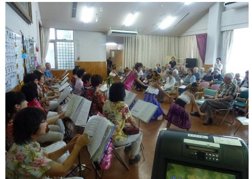
今月は寿生苑デイサービスにて、ウクレレフラダンスと共に歌の交流会でした。

今月号で3回目になりました、サロン田鶴参加者様に活動報告を頂くシリーズです。今回はサロン田鶴顧問よりサロン田鶴の歴史についてご報告いただきしたいと思います。 今から15、16年前の事だったと思う。元岡校区は、九州大学の移転に伴って急速に人口が増加し都市化が進んできた。また同時に近隣の人の交際も希薄になって、地域の連帯感が崩れていった。私達は民生委員として、このことを非常に憂い、昔のような近隣の和を取り戻すべく奔走した。先ず、先輩方と相談し自治会長の許しを得て、校区ふれあいネットワークを立ち上げ、校区民全員による挨拶運動を展開した。この運動の名残が今も公民館等でみられる標語である。 さてふれあいサロン田鶴であるが、福岡市からの強力な指導もあって、老人クラブと提携し、諸事情により石崎の集会所で実施することとなった。 孤独死が各地で頻発する等、昔のような近隣の支え合いの必要性が社会の課題にもなっていた。特に田尻地区では新しい住民との日ごろの交際を強力に推し進め楽しい地域づくりが一番必要ではないかと思う。この場所がサロン田鶴だ。その後、田尻西、田尻東町内を範囲として開催されるようになった。今日では、開催場所を特別養護老人ホームに移し、毎月第1水曜日に入所者も一緒になって、楽しく過ごしている。 昼は食事を交え懇親し参加者相互の交流が深まっている。地域の誰もが家に引きこもらずに気軽に参加頂く事を願っている。